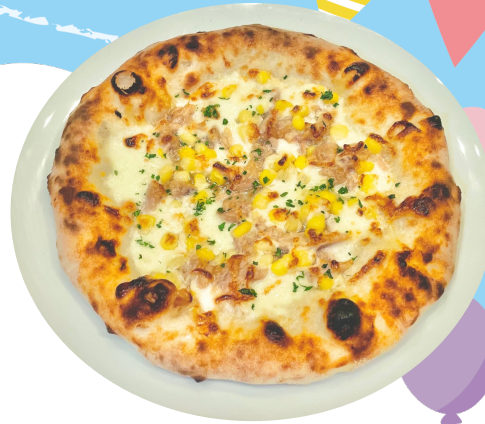
ツナとマヨコーンのピッツア