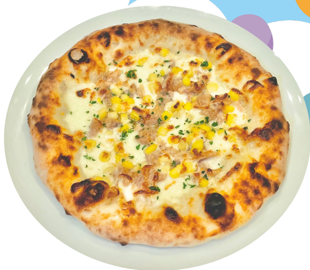
ツナとマヨコーンの ピッツア