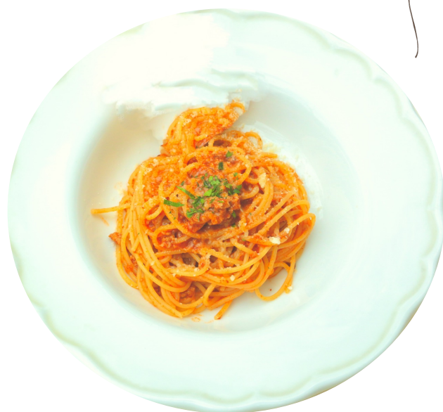
ミートソースパスタ